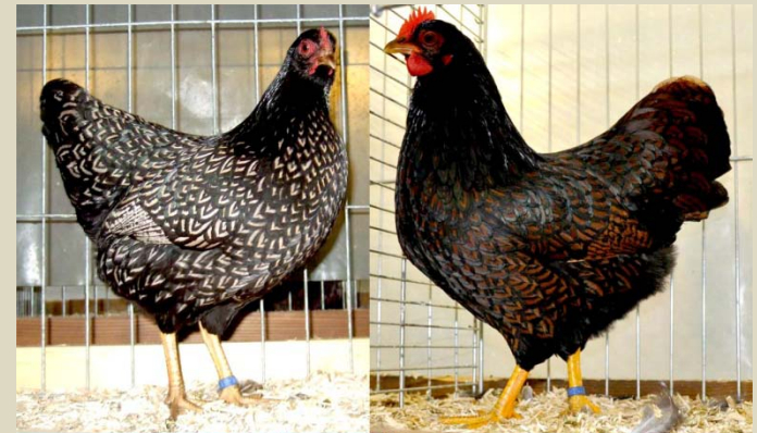
Zwei Farbenschläge und 2x V97

Eine rege Diskussion dazu, die zur Jahreshauptversammlung vorgestellt und von der Versammlung einstimmig beschlossen wurde das Gewicht anzupassen. Mit dieser Änderung passen sie immer noch gut in einen Zwerghuhnkäfig. Die Zwerg-Rhodeländer bekommen da eher Probleme.