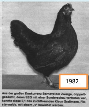
1,0 Zwerg-Barnevelder, sg 1 GEBV. Züchter: K. Graßmann, Finsterwalde